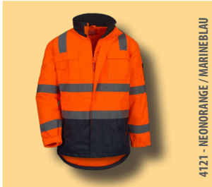
4121 - NEONORANGE / MARINEBLAU