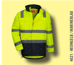
4021 - NEONGELB / MARINEBLAU