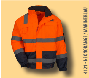
4121 - NEONORANGE / MARINEBLAU