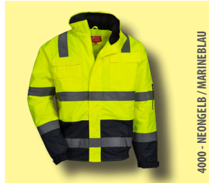
4000 - NEONGELB / MARINEBLAU