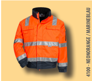
4100 - NEONORANGE / MARINEBLAU