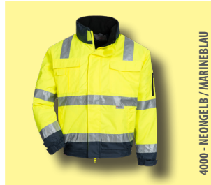
4000 - NEONGELB / MARINEBLAU