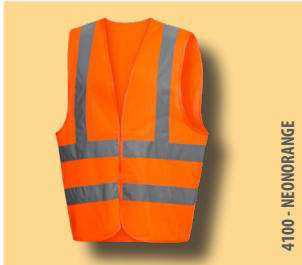
4100 - NEONORANGE