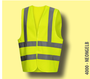
4000 - NEONGELB