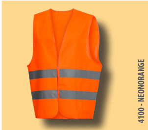
4100 - NEONORANGE