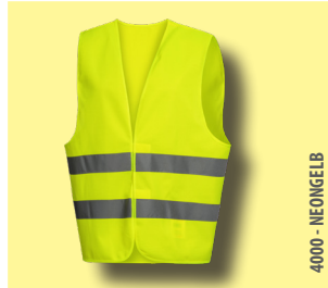
4000 - NEONGELB