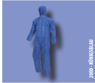
2000 - KÖNIGSBLAU