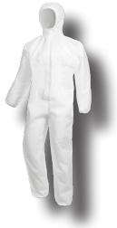
1100 - WEISS